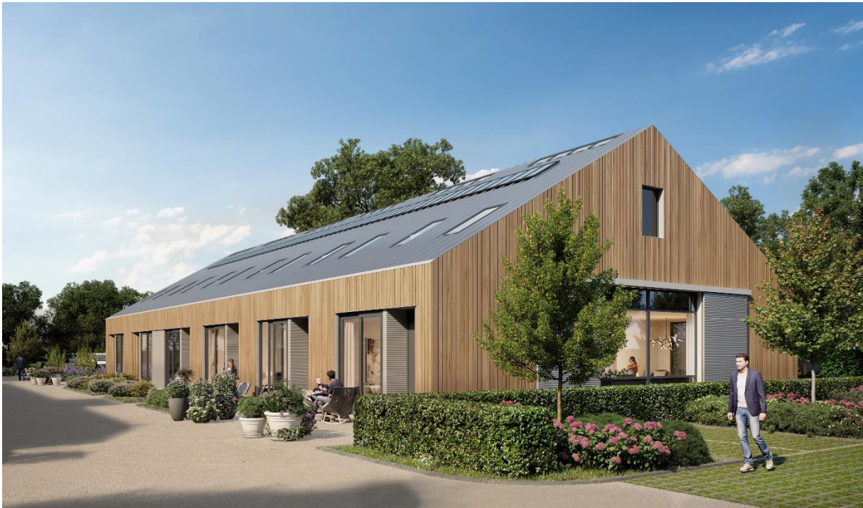
Sfeerimpressie, hier kunnen geen rechten aan ontleend worden